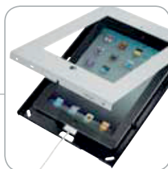
Facile à installer