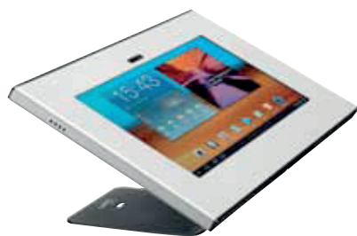
TabLock® pour Samsung Galaxy Tab 10.1

Le TabLock pour iPad est disponible en deux versions. Une version est dotée d'un bouton d'accueil accessible, permettant aux utilisateurs d'arrêter des applications et d'en commencer d'autres. Et une version où le bouton d'accueil est protégé. Il y a aussi un TabLock disponible pour le Samsung Galaxy Tab 10.1. L'ouverture de l'appareil photo du TabLock se trouve sur la partie avant. On peut utiliser les trous d'épingle pour l'alimentation et le volume.