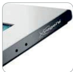
Trous d'épingle pour éviter toute opération non autorisée.