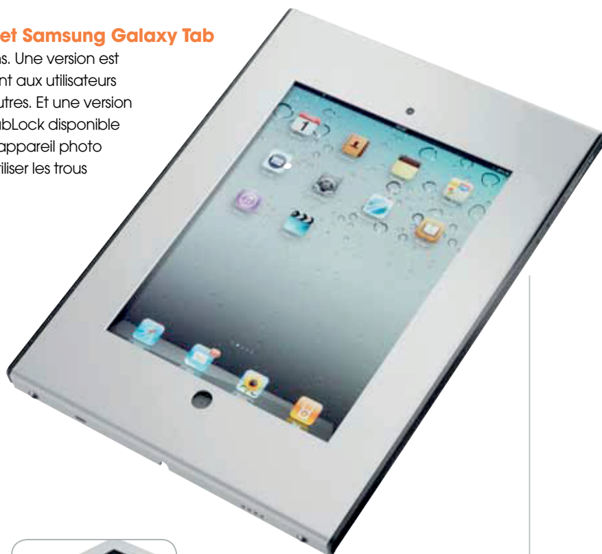
TabLock® pour iPad 2 et 3 ème génération