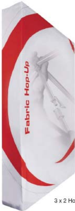
3 x 2 Hop-up

Les systèmes de tissu tendu sont spécialement adaptés pour les visuels grand format.